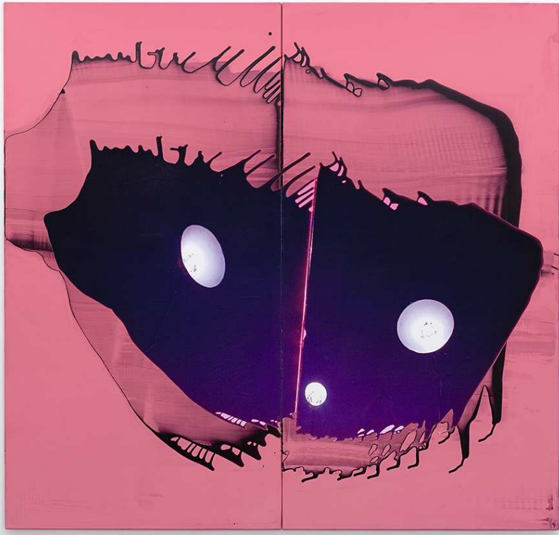
Dominique Figarella, Qui est ? , 2004, tirage numérique, peinture sur aluminium, 200 x 220 cm, Collection le musée de Sérignan