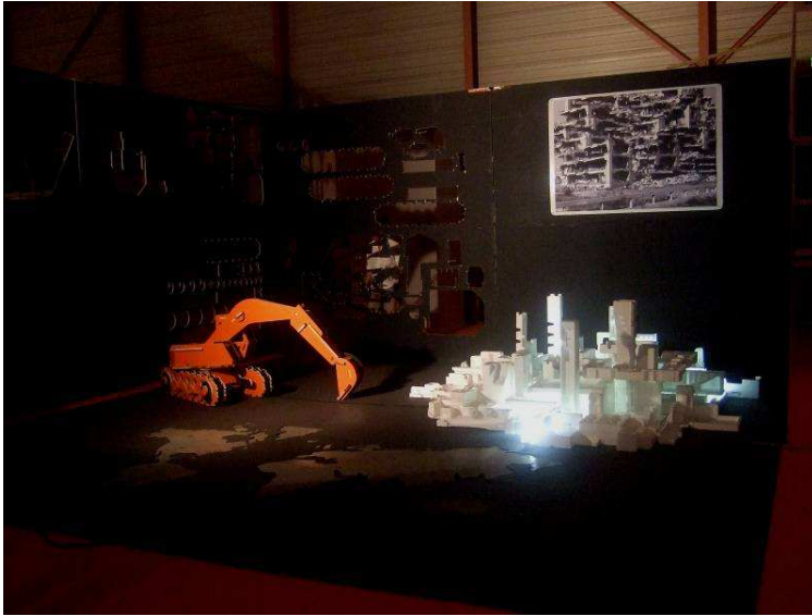
Jean Denant, Anarchitecture , Foire d'art contemporain de Nîmes, 2007