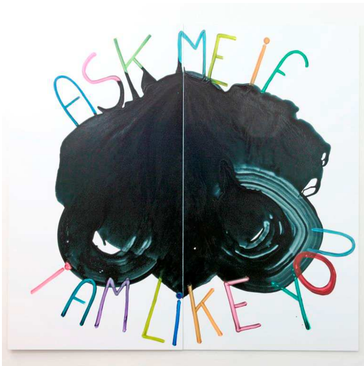
Dominique Figarella, sans titre, 2008, peinture sur aluminium, 150 x 200 x 1 cm