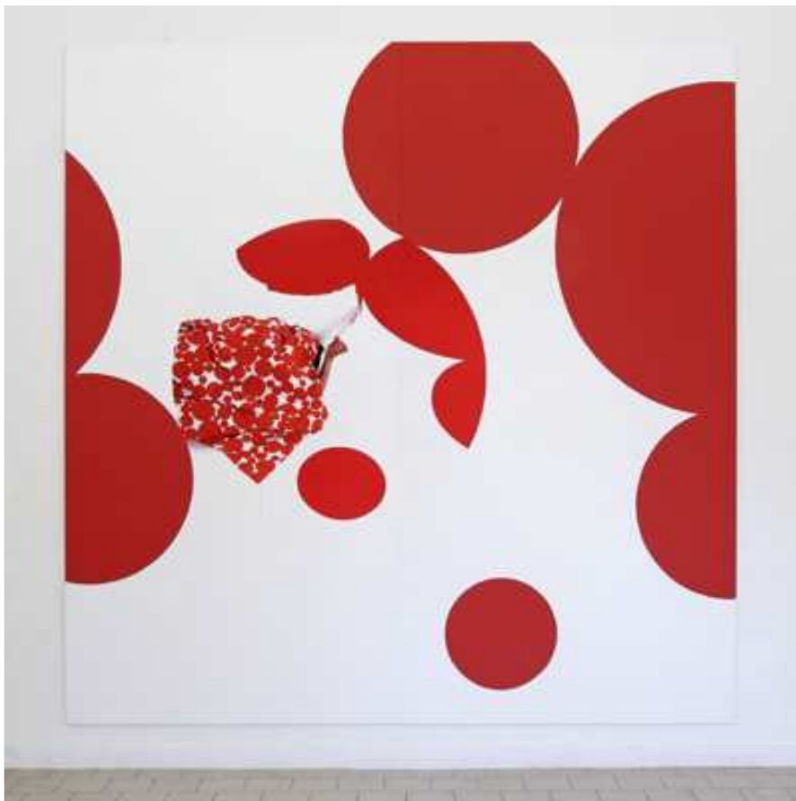
Dominique Figarella, sans titre, 2008, tirage numérique et peinture sur aluminium, 304x300x1cm